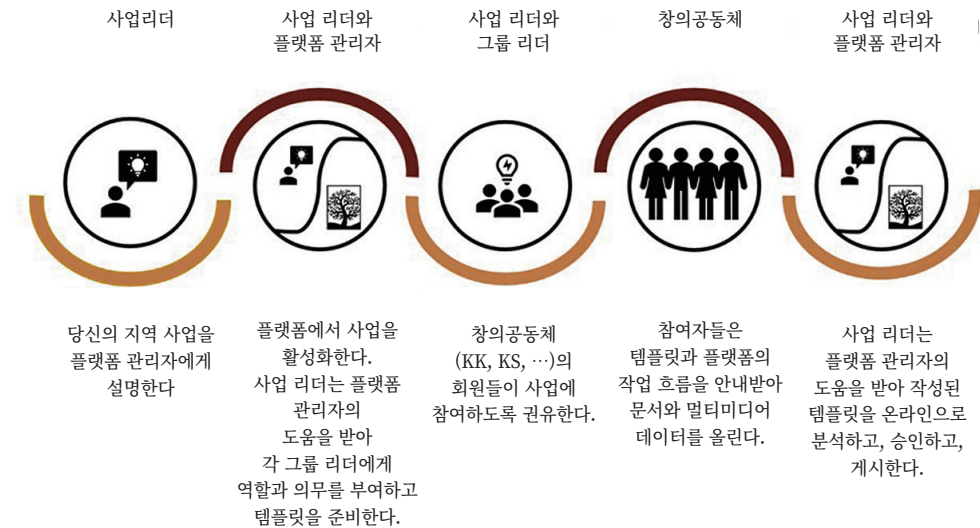
도표 1. CKP의 작업 흐름 및 사업 관리

사용자들이 특정 주제에 관한 정보를 원격으로 올릴 수 있는 공동 웹 공간을 마련함으로써 CKP는 사업들을 추진하고 관리한다. 사업 소유자(사업 리더)는 그림 1과 같이 이 플랫폼의 작업 흐름을 통해 수집된 데이터들을 온라인으로 평가하고 게시한다.